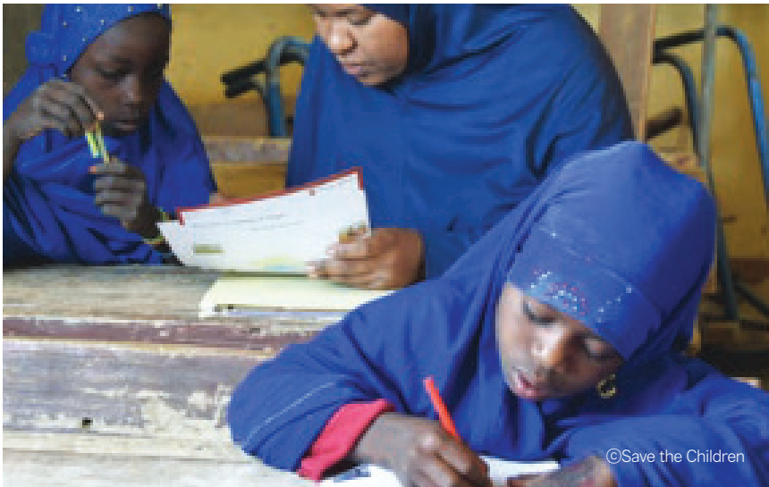
학교 수업에 참여 중인 아동의 모습

학교에 입학한 아동이 기초 문해와 수리를 포함한 학습역량을 키워나가는 데 필요한 교육자료를 지원합니다. 양질의 교육을 제공하기 위해 교사 역량 강화 교육을 진행하고, 독서클럽 등 아동들이 참여하는 교육 활동을 지원합니다. 다양한 사유로 학업을 중단하였거나, 학교에 다니지 않는 아동들이 학교로 돌아와 학업을 이어나갈 수 있도록 아동의 학교 등록을 지원합니다.