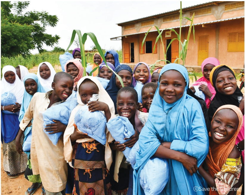
모기장을 지원 받은 아동들의 모습

모든 아동이 학교시설을 자유롭게 편리하게 이용할 수 있도록 교실과 식수 시설, 화장실을 신축 또는 개보수합니다. 아동들이 균형 잡힌 영양을 섭취하고, 학업을 꾸준히 이어 나갈 수 있도록 학교 급식을 지원합니다.