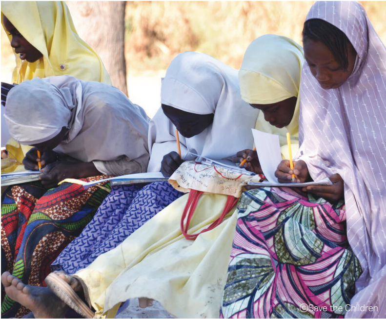
위생교육에 참여하고 있는 아동들의 모습

청소년을 대상으로 성교육을 진행하고, 청소년기에 필요한 보건서비스와 위생 키트를 제공합니다. 보건서비스 종사자가 청소년기의 특성을 이해하고, 청소년 친화적인 서비스를 제공할 수 있도록 교육을 진행합니다. 청소년을 대상으로 직업 및 생활 기술 교육, 금융 교육을 진행하여 청소년들이 안정적으로 성인기를 맞이할 수 있도록 지원합니다.